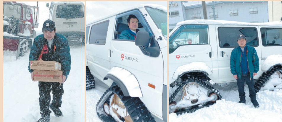
▲サングラス、帽子、長靴が必需品！