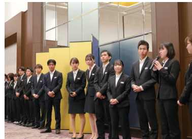
▲新入社員は一人ずつ自己紹介、今後の目標などを宣言