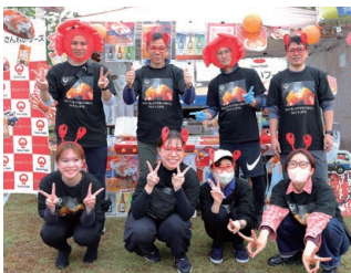
▲新デザインのイベント用オリジナルTシャツをお揃いで着用しました！

*グラナパウダー：イタリア北部のハードタイプのチーズ（グラナパダーノ）のパウダータイプ