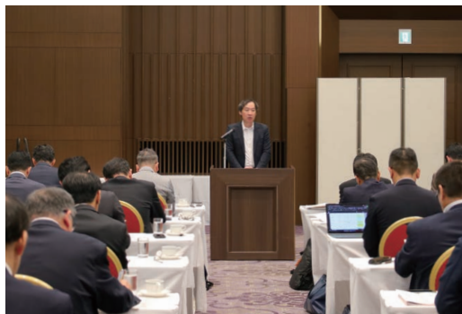
▲並河社長「策定された中期ビジョンが全社員の道しるべとなれば」と期待。

さらに、合併から一年半を経た現在、「さんれいフーズ」としての一体感づくりも大きなテーマに。「安全安心を軸に、より良い商品とサービスを全員で届けていく。この取り組みを一つの会社・自分ごととして捉え、ともに成長に繋げていきましょう」と呼びかけました。