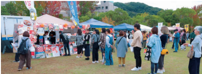
▲絶え間なくお客様が訪れ、コロッケの揚げが追いつかないほどのにぎわい。

当日はチーズの香りとともに多くの方に足を止めていただき、コロッケは早々に完売。地元の方々をはじめ観光客にも、当社商品の魅力を直接お伝えできる貴重な機会となりました。