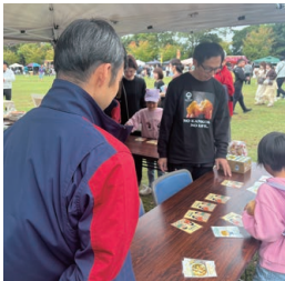
▲当日の運営は第1事業部 米子支店やメディカルグループが担当。

企業ブースでのゲーム、オ×クイズ、どちらも子どもたちだけでなく参加して下さった皆さまも一緒に楽しんで盛りあげて下さいました。企画を考えることで自分自身も学ぶことが多く貴重な機会となりました。当日はお揃いのTシャツを着用し参加メンバー一体となって楽しむことができました。地域の皆さまが少しでも「食への関心」を持てるきっかけになれば非常に嬉しく思います。