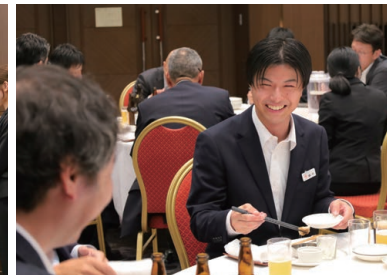
▲参加者同士、各テーブルで和やかな交流が見られました