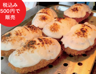
▲「炙チーかにコロ」に続く、かにクリームコロッケのアレンジ展開に今後も期待！